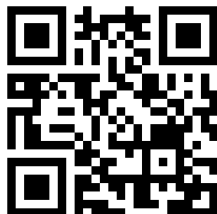
二次元バーコード